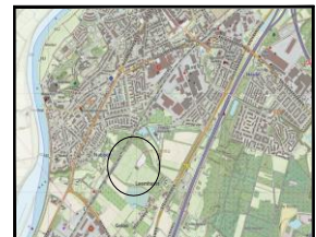
Overzicht van de situatie

Notitie - Het verspreiden is heten van de S.A.P. - Het verspreiden is heten van de S.A.P. - De ligging van de water en waterloop is niet vastgesteld. Er is een waterloop in de omgeving. - De ligging van de water en waterloop is niet vastgesteld. Er is een waterloop in de omgeving.